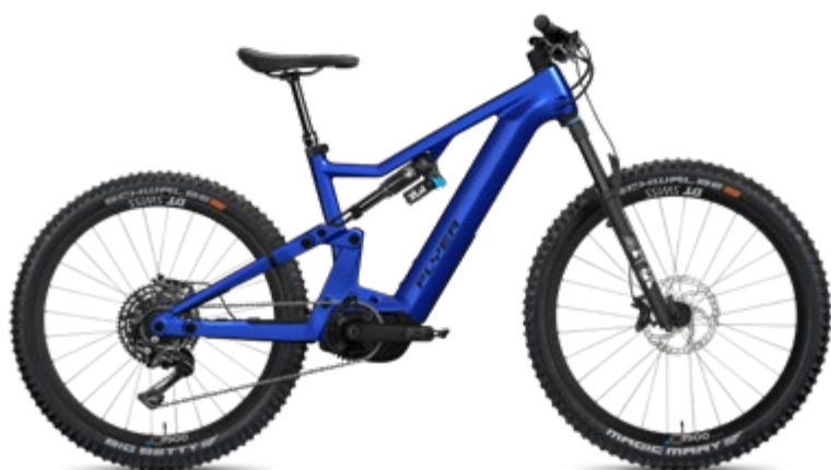
8.70 Enzian Blue Gloss