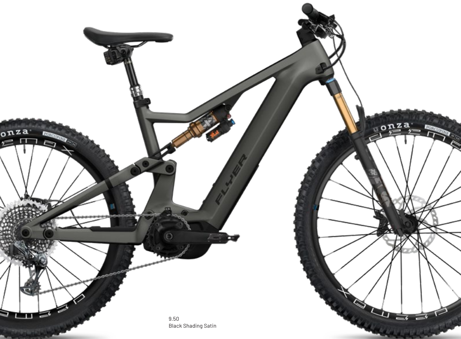
9.50 Black Shading Satin

Pro FIT»-Motor liefert mit 95 Nm Drehmoment und 600 Watt Spitzenleistung kraftvolle Unterstützung. Die mit einem Bolzen verschraubte Akku-Befestigung garantiert einen absolut festen, vibrationsfreien Sitz des vollintegrierten Akkus und ermöglicht es gleichzeitig, diesen mit wenigen Handgriffen zu tauschen – auch unterwegs auf dem Trail. Ein Ausstattungshighlight bei den Modellen 9.50 und 8.70 ist das Cockpit mit integriertem Multitool und mit Carbon-Lenker. Über die integrierte «MonkeyLink»-Schnittstelle lässt sich mit einem Handgriff ein Frontlicht anschliessen, das über den E-Bike-Akku gespeist wird.