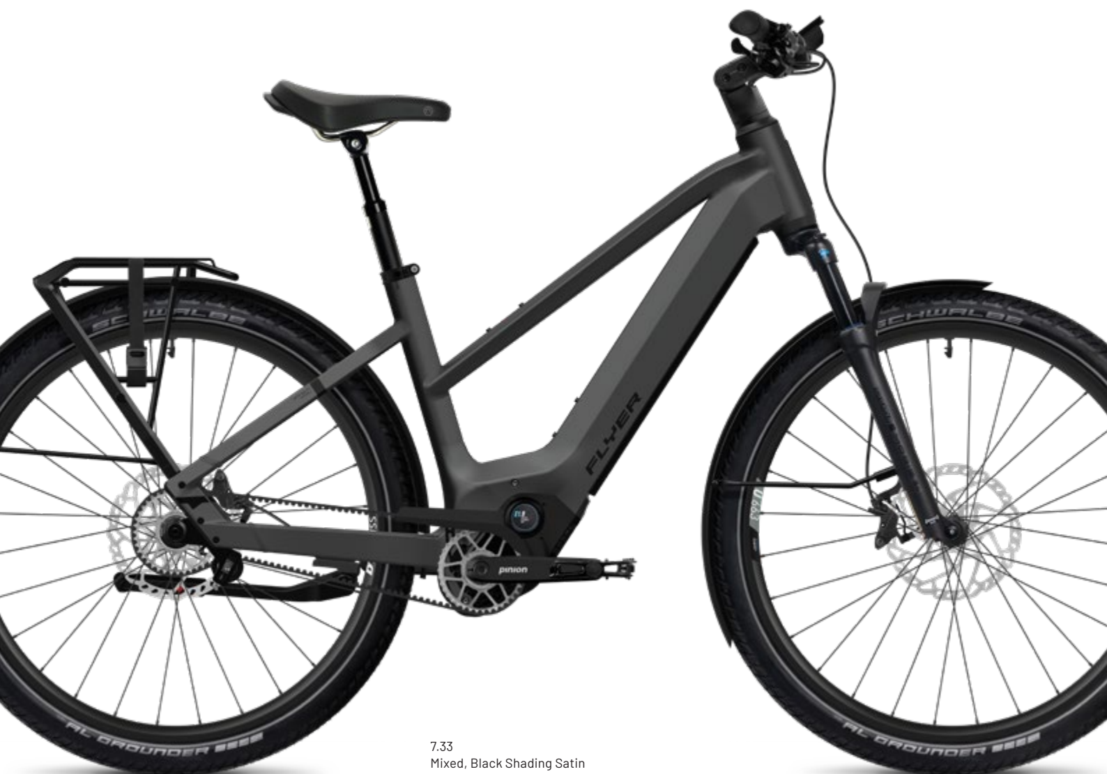
7.33 Mixed, Black Shading Satin

Ein besonderes Highlight: Die aussergewöhnliche Schalt-Automatik passt sich von selbst und sehr sanft an Ihr Fahrverhalten an, so dass Sie mühelos durch den Stop-and-Go-Verkehr manövrieren. Sie werden begeistert sein – versprochen.