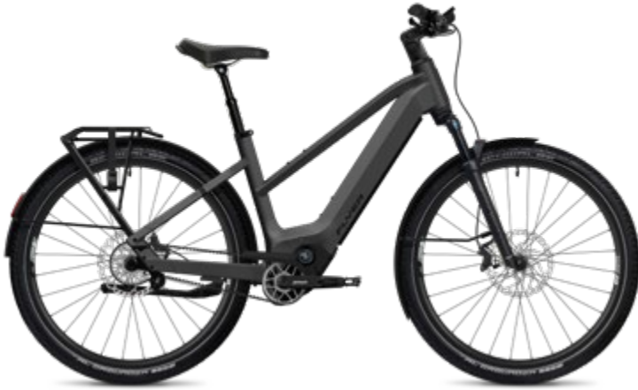
7.33 Mixed, Black Shading Satin