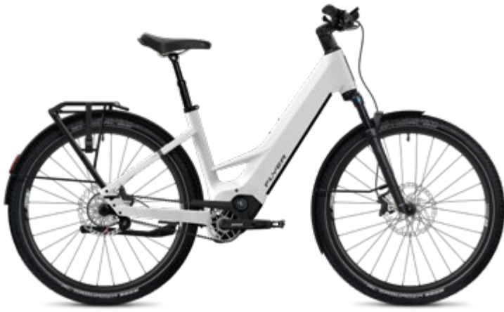
7.33 Comfort, Pearl White Satin